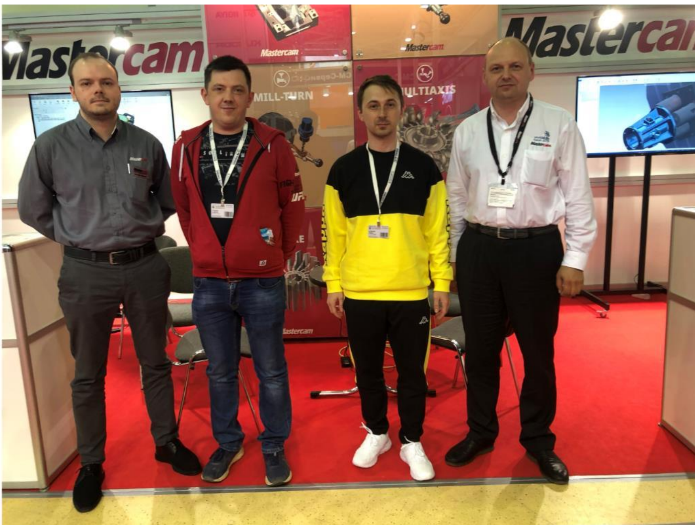
Пользователи Mastercam в АО «НПО «СПЛАВ» имени А.Н. Ганичева» (г. Тула).