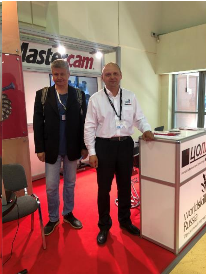
Консультации по разным аспектам приобретения, освоения и применения Mastercam