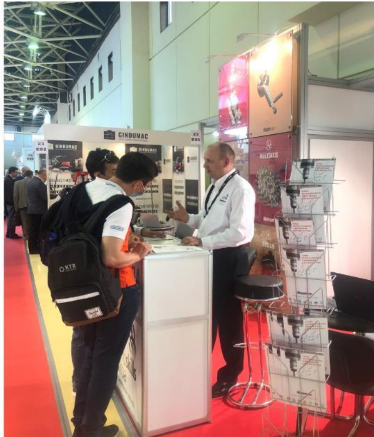
Консультации по разным аспектам приобретения, освоения и применения Mastercam