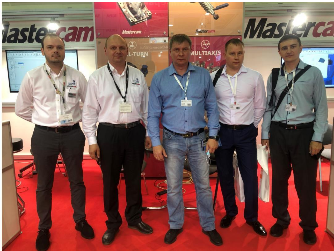
Делегация сотрудников и пользователей Mastercam предприятия «Велмаш-С» (г. Великие Луки), входящего в Группу ПАЛФИНГЕР СНГ.