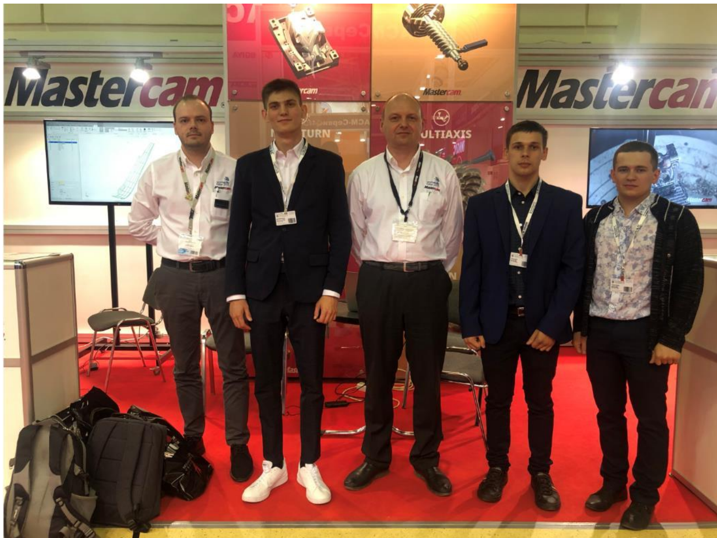
Делегация сотрудников и пользователей Mastercam предприятия «ДСТ-УРАЛ» (г. Челябинск)