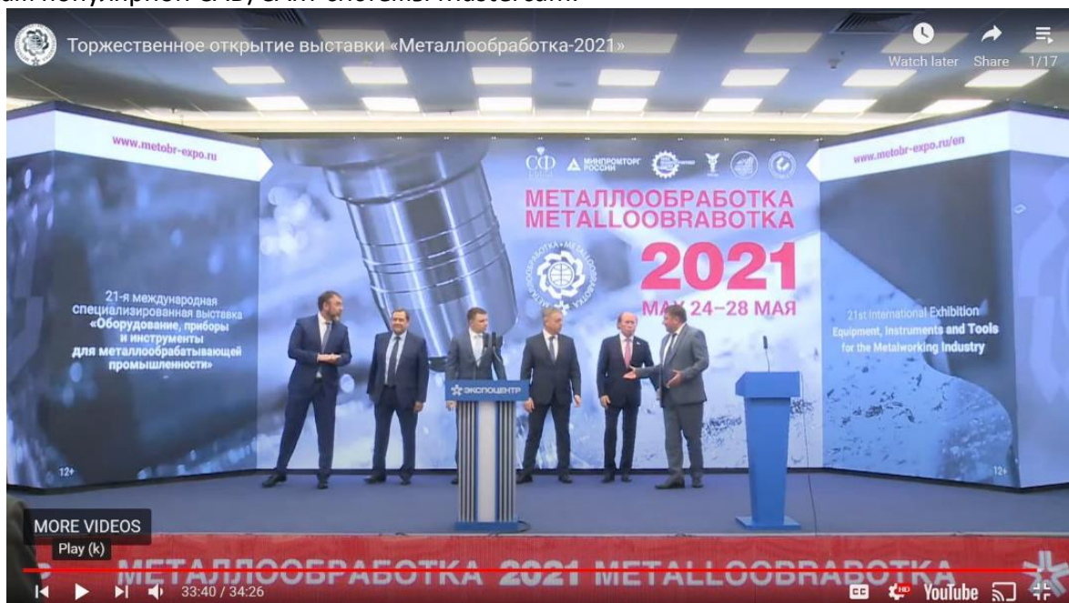
Церемония открытия выставки «Металлообработка-2021» в Москве.

Группа компаний «ЦОЛЛА» участвует более 12 лет подряд в этом смотре современного оборудования, инновационного инструмента и передовых технологий цифровизации и автоматизации производства, в том числе CAD/CAM-систем. «Металлообработка - 2021» – успешная попытка возвращения к привычной «нормальности», первая «живая» выставка во время непомерно затянувшейся и осточертевшей всем пандемии COVID-19. Конечно, удивляло полное отсутствие масок, но радовало счастливое выражение на лицах давно не встречавшихся клиентов и экспонентов. На ажиотажный спрос в нынешних условиях никто, разумеется, и не мог рассчитывать, но вновь напомнить о себе и предъять «городу и миру» свои новые решения и достижения наверняка удалось большинству экспонентов, в том числе и нам – поставщикам популярной CAD/CAM-системы Mastercam.